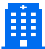
Выбор зарубежной МО, согласованной с пациентом

ИТОГО: Направление граждан РК на лечение за рубеж занимает до 37 рабочих дней