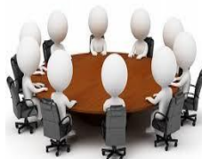
Комиссия при Министерстве здравоохранения РК