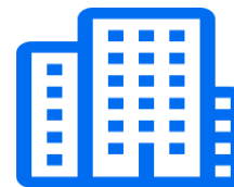
Рабочий орган (РО) при АО «Нац. научный центр материнства и детства»