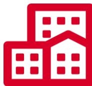
Профильная научно-исследовательская организация (НИИ) (11)