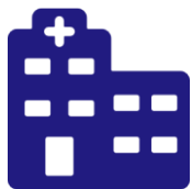
Врачебно-консультативная комиссия (ВКК) при поликлинике