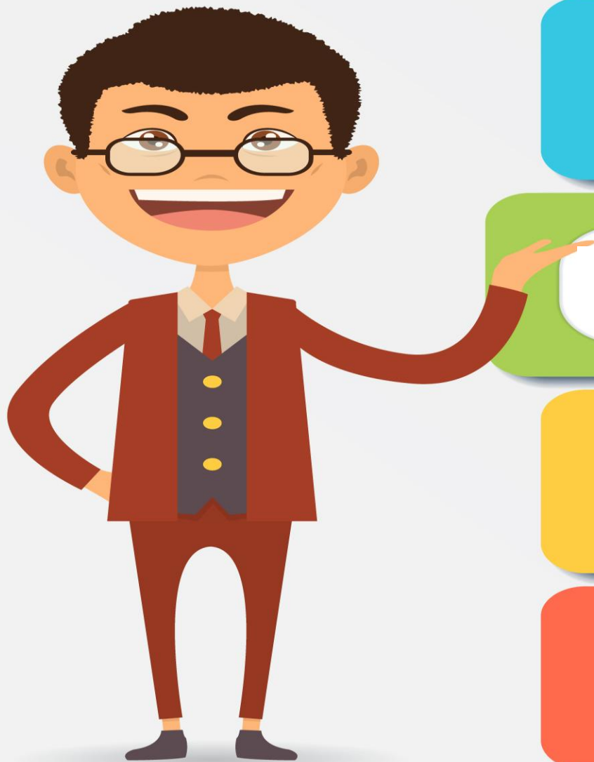
Схема рассмотрения обращений граждан в области здравоохранения